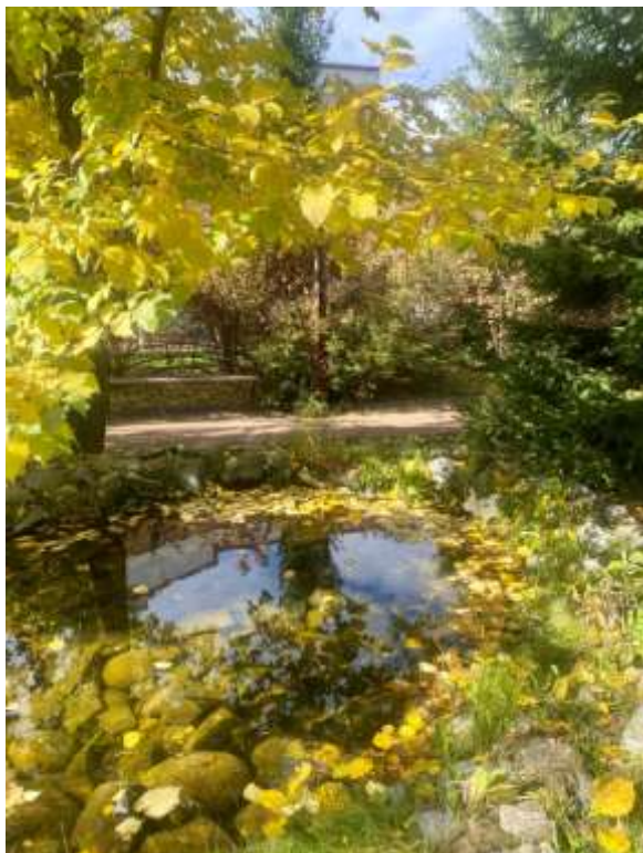
Пейзаж « Осенняя тишина» Прокопьева Арина