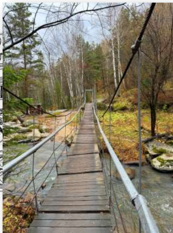
Пейзаж «Тропинка испытаний» Прозоров Лаврентий