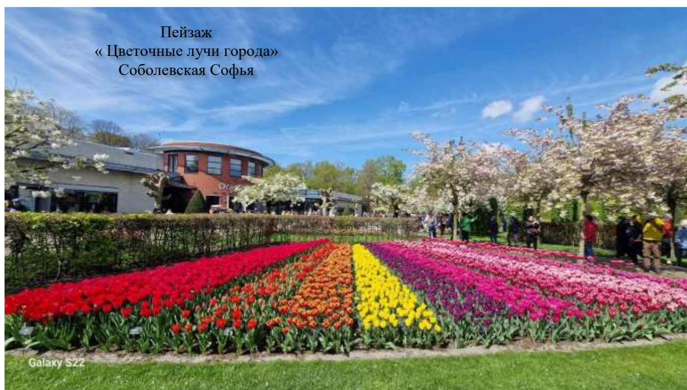
Пейзаж «Цветочные лучи города» Соболевская Софья